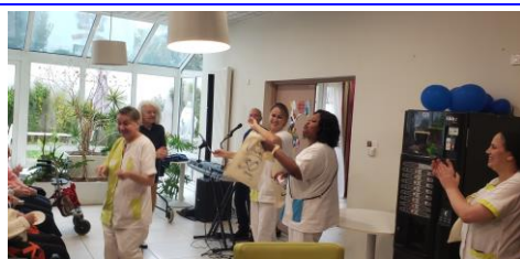
Fête des anniversaires