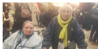
Départ pour Lourdes 2024

Lors de l'enquête de satisfaction 2023, nous avons bien pris note d'une insatisfaction concernant la prise en charge du linge des résidents. Nous vous informons que nous changerons de prestataires à compter du 21 novembre. Une réunion d'informations sera organisée prochainement