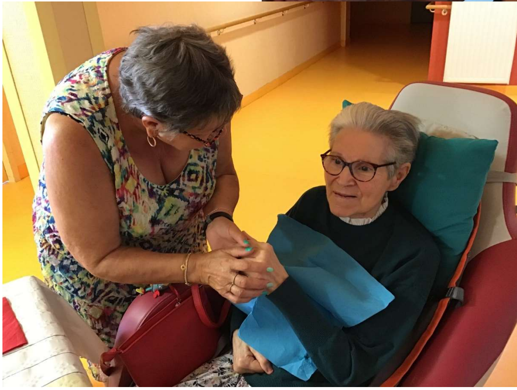
La fête c'est cela : un moment partagé ensemble !